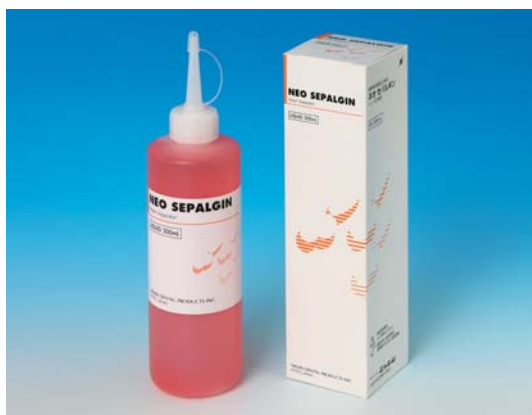
その他の矯正材料／矯正関連用材料

管理医療機器 承認番号:21700BZZ00271000 歯科矯正用レジン材料 株式会社ロッキー・マウンテンモリタOEM品