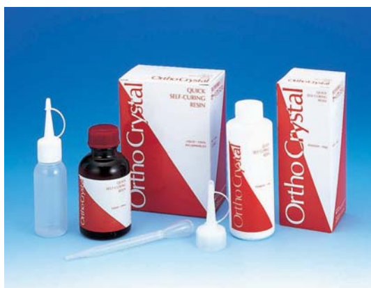
矯正用常温重合型レジン／矯正関連用材料