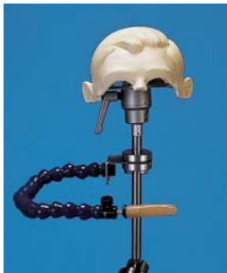
ヘッドベースユニット