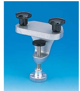
デスクランプユニット