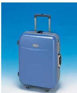
トランクユニット